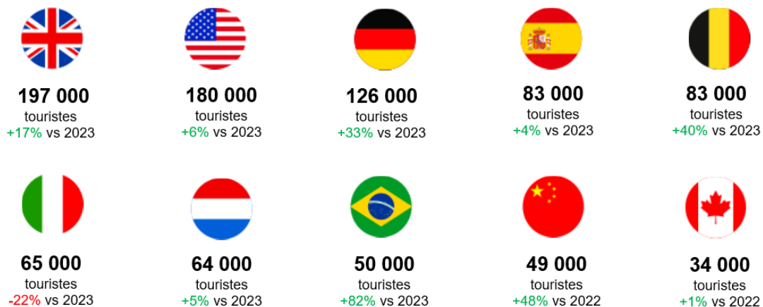
Figure 1 : Source Choose Paris Region. Estimations à partir des données ATR et Flux Vision.

Les principales clientèles internationales présentes durant cette période sont anglaises, américaines et allemandes représentant à elles seules 1/3 des touristes internationaux (soit 500 000 touristes pour 1,5 millions au total). A noter, une progression de la fréquentation de certains pays comme le Brésil (+82%), la Chine (+48%) ou encore la Belgique (+40%).