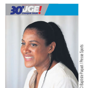
Marie-José Pérec, triple championne olympique

«Je milite pour cette grande cause que représente le sport, le sport qui crée un rêve, qui donne une chance, le sport qui nous rassemble, le sport qui fixe des objectifs, qui pousse au dépassement, malgré les échecs, le sport qui est une école de la vie.»