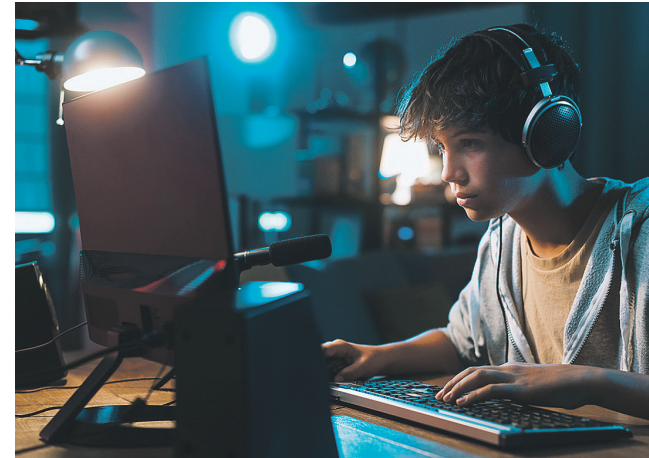
La place prise par les écrans dans notre quotidien est l'une des principales causes de la sédentarité.

pisme en France, l'objectif sera « d'améliorer le bien-être de tous et de lutter contre les maladies liées à la sédentarité ». L'enjeu est simple : encourager chaque individu, peu importe son âge ou son niveau de forme physique, à consacrer 30 minutes par jour à l'activité physique au sens large. Pas question, donc, de contraindre chacun à s'inscrire dans une salle de gym ou un club de sport : l'essentiel est de saisir chaque opportunité d'entretenir sa forme physique : une simple promenade, une marche active, une séance de course à pied, une séance de vélo, de méditation, de yoga ou de danse ou même un moment passé à jardiner peuvent faire toute la différence ! Toujours selon l'OMS, une activité physique régulière facilite la prévention et la prise en charge de maladies telles que les maladies cardiaques, les accidents vasculaires cérébraux, le diabète et plusieurs types de cancers. Elle contribue également à prévenir l'hypertension, à maintenir un poids corporel sain et à améliorer la santé mentale, la qualité de vie et le bien-être. Au-delà de 50 ans, remplacer une heure de « temps assis » par une heure d'activité physique peut permettre de réduire la mortalité de plus de 50 %*. En 2024, adieu les ascenseurs, vive les escaliers : on se bouge plus, plus souvent et plus régulièrement !