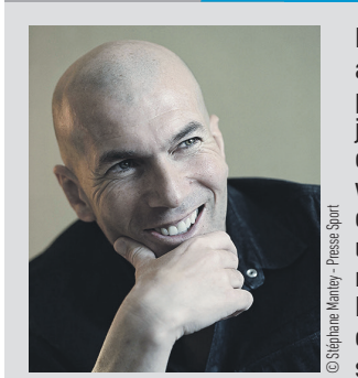
Zinedine Zidane, entraîneur et ancien footballeur international

Le sport, c'est ma vie, mais bien avant d'en faire mon métier, pour moi, c'était synonyme de jeu, de partage, de rire avec les copains du quartier... bref, la vie. Et une passion pour le sport collectif bien sûr... alors après une carrière professionnelle, maintenant, retour aux sources! Et croyez-moi, même quand on a été sportif de haut niveau, même si on s'appelle Zidane (rires), lorsqu'on s'arrête, ce n'est pas si facile de s'y remettre... On n'a plus besoin de prouver les bienfaits de faire un peu de sport, de faire un peu d'exercice régulièrement... mais en ce qui me concerne, c'est tellement important, pour tout: la santé, le bien-être, le plaisir aussi bien sûr, seul, en famille ou avec les potes! Chacun fait comme il peut mais on ne regrette jamais de se bouger un peu... juste un peu, mais régulièrement! Toutes les occasions sont bonnes pour tout le monde!