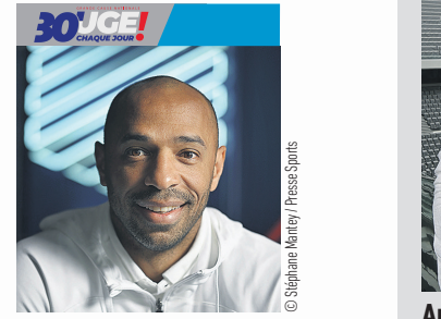
Thierry Henry, sélectionneur de l'équipe de France espoirs de football

Bouger au quotidien permet de limiter les risques de maladies chroniques comme le cancer, l'obésité ou le diabète de type 2 mais aussi de maladies cardiovasculaires. L'activité physique est ainsi un levier important de prévention de l'infarctus du myocarde, des accidents vasculaires cérébraux et de l'hypertension. De même, une activité physique adaptée à la pathologie est recommandée lorsque l'on est touché par certaines maladies chroniques, en parallèle des traitements médicaux. Le sport permet également de limiter le risque de récurrence, par exemple lorsque l'on est en période de rémission d'un cancer.