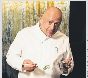
Thierry Marx, entrepreneur et chef cuisinier

Pour moi, tout a commencé très jeune... À 12-13 ans, je suis peu ou prou déscolarisé mais quand je pousse la porte du club de judo de Champigny-sur-Marne, je sors de la cage d'escalier, je canalise mon énergie, j'apprends la discipline avec mon professeur et je respecte les adversaires qui sont plus forts que moi. Le sport a été le meilleur cadre éducatif que je pouvais espérer. Alors oui, je milite pour le sport; pour que tous les jeunes, et surtout ceux qui ont des difficultés, puissent se construire, aller de l'avant. La deuxième chose qui a changé ma vie, c'est la cuisine. Qu'est-ce que la cuisine? c'est comme le sport: plaisir, bien-être, santé. Le sport et la gastronomie sont selon moi deux choses indissociables. En tant que restaurateur, Brief, le sport sait tout faire!