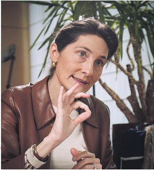
Quels seront les principaux messages de la campagne à venir ?

L'objectif de la toute première Grande Cause Nationale de notre histoire dédiée à l'activité physique et sportive est d'abord d'inciter les Français à faire plus de sport en créant des occasions nouvelles de mettre ou de remettre le pied à l'étrier. Ce label va donner au projet une légitimité et une portée uniques, autour d'un marqueur fort, qui sera au cœur de notre campagne : celui, je le disais, de réaliser 30 minutes d'activité physique chaque jour, en lien avec les recommandations de l'OMS. Réussir ce défi 5 fois par semaine, ce serait déjà formidable. Ces 30 minutes, il ne s'agit pas nécessairement de les investir dans une pratique sportive de haut niveau, loin s'en faut : l'essentiel est de saisir chaque occasion de bouger plus, avec si possible plus d'intensité que d'habitude. Mais surtout, il faut consacrer cette demi-heure à des activités adaptées à son rythme, à ses envies, à ses possibilités. Je